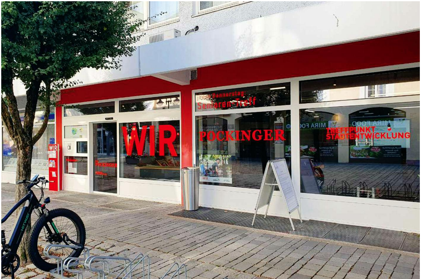
Das Pockinger, Am Stadtplatz 2.