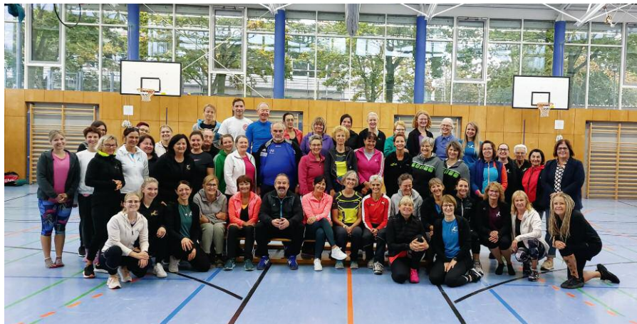
52 Übungsleiterinnen und Übungsleiter haben den zweiten Aktionstag in Pocking genutzt, um ihre Übungsleiterlizenz zu verlängern.