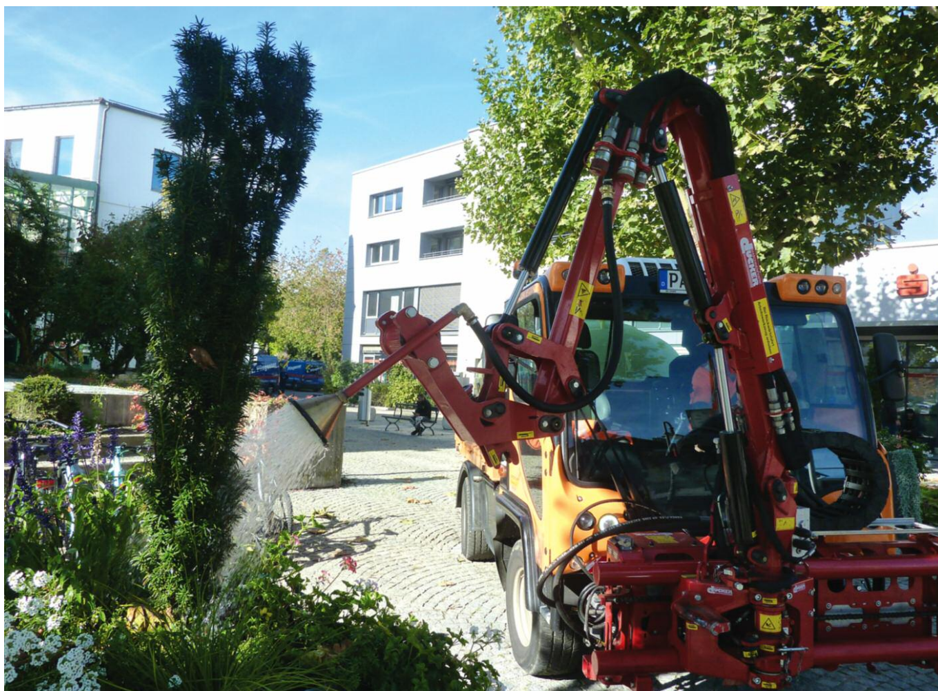
Gärtnergeselle Rainer Stapfer (am Steuer) freut sich über die nun weniger aufwendige Bewässerung der Pflanzkübel im Stadtgebiet.