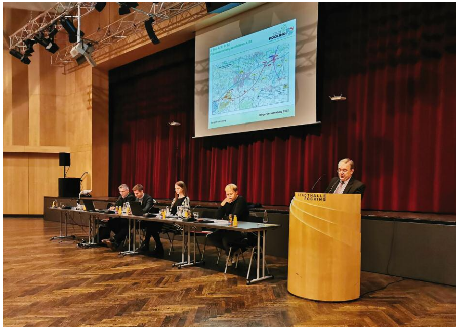
Jedes Jahr informiert Bürgermeister Franz Krah die Bürgerinnen und Bürger über städtische Angelegenheiten; heuer auch per Livestream aus der Stadthalle.

Unter www.pocking.de finden Sie weitere Informationen und können