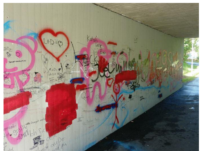
Regelmäßiges Ziel sind auch Unterführungen für Personen, die sich offenbar anders nicht ausdrücken können.

Auch die Fahrradladestation am Naturfreibad ist vor dummen Menschen nicht sicher. Ein Ladevorgang ist hier bis zur Schadensbehebung nicht möglich. Zudem besteht eine Gesundheitsgefahr, sollten etwa Kinder an diese freigelegten Leitungen fassen.