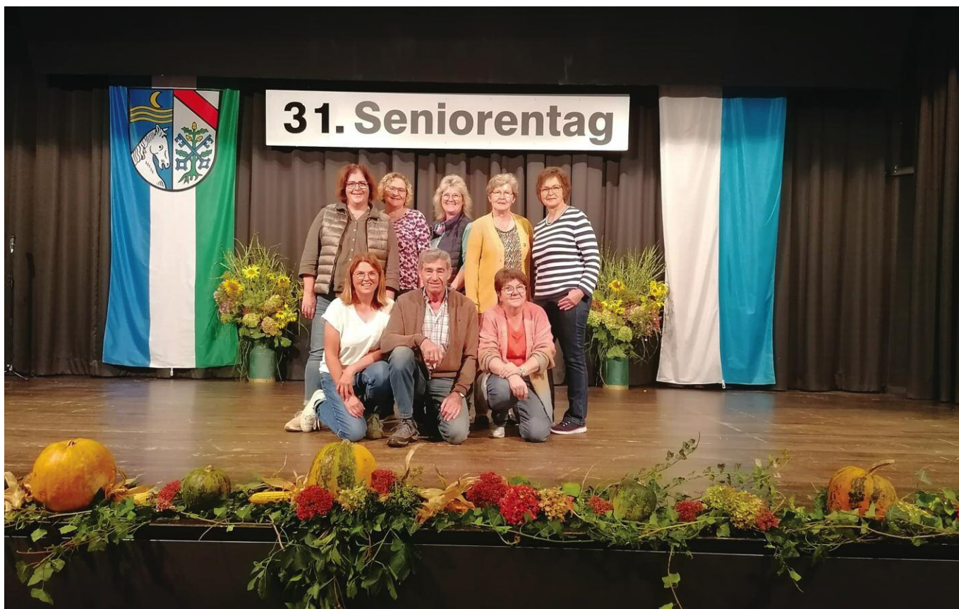
Der Gartenbauverein übernahm wieder die prachtvolle Dekoration der Stadhalle.