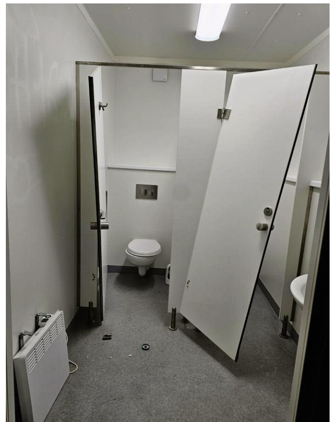
Die neue öffentliche Toilette am Ausbeckplatzl wird regelmäßig beschädigt. Die Öffnungszeiten müssen daher während der Nachtzeiten reduziert werden.