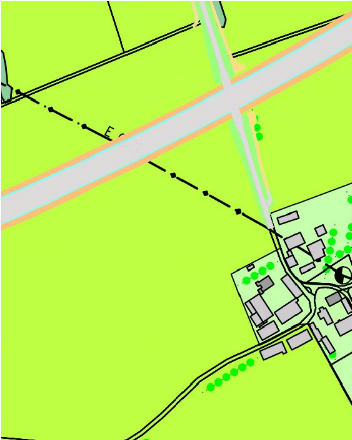
Abbildung 1: Ausschnitt aus dem rechtskräftigen Flächennutzungsplan der Stadt Pocking