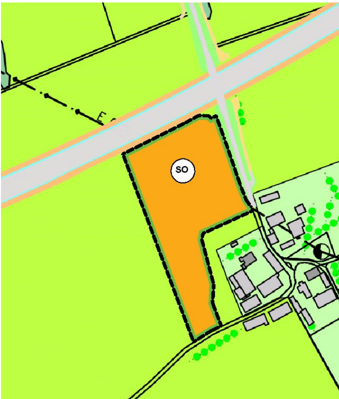
Abbildung 2: Deckblatt Nr. 86 zum rechtskräftigen Flächennutzungsplan der Stadt Pocking