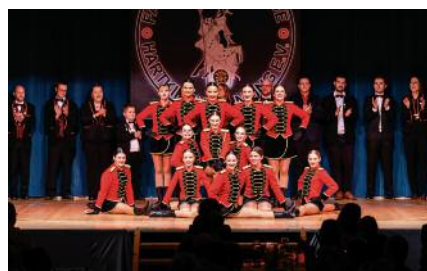
oben: Tennygarde Marsch unten: Teenygarde Showtanz