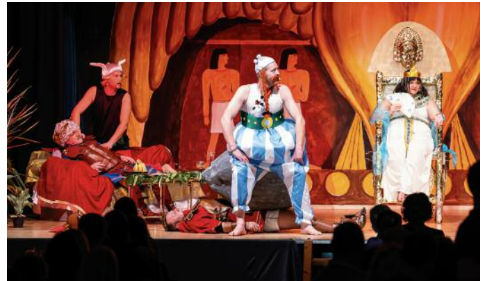
Eröffnung mit dem traditionellen „Faschings-Ausgraben“

Die Faschingsfreunde Hartkirchen-Inzing e.V. bedanken sich für die bisher zahlreichen Gäste und freuen sich auf einen schönen Faschingsendspurt!