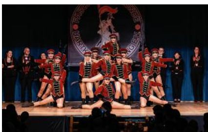
oben: Inzinger Garde Marsch unten: Inzinger Männergarde