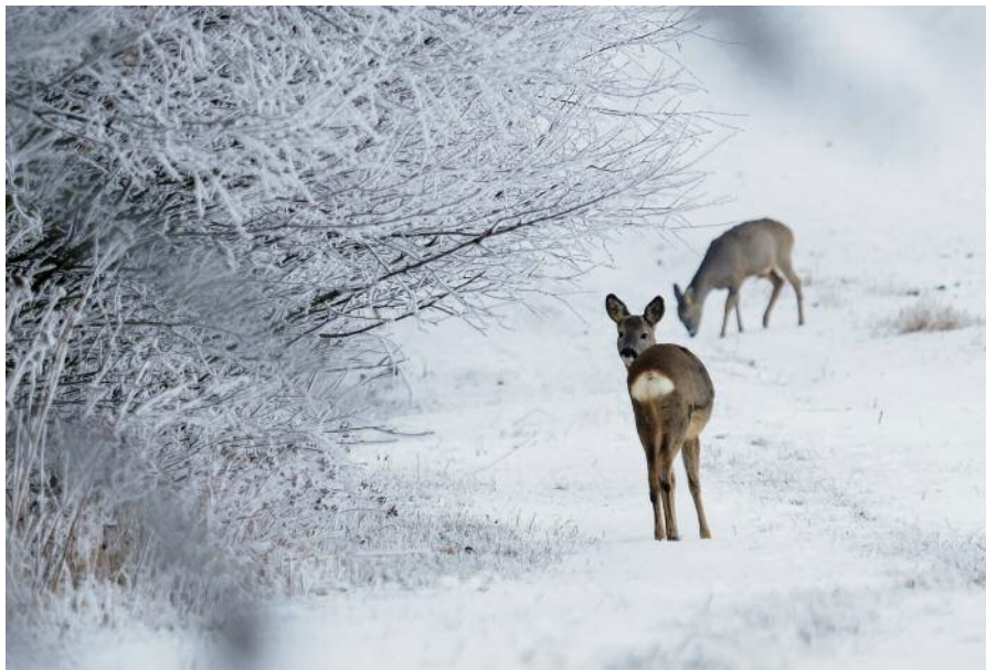
„Zwei Rehe im Winter“

Im Winter befinden sich Wildtiere zusätzlich im „Energiesparmodus“.