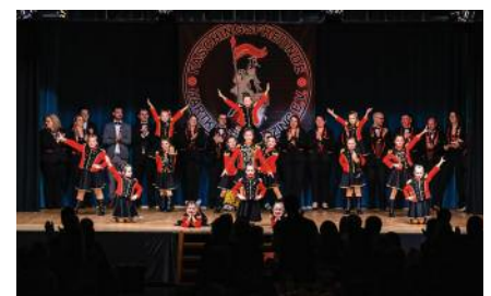
oben: Kindergarde Marsch unten: Kindergarde Showtanz