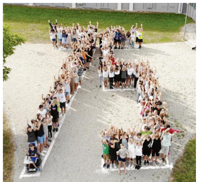
ggf. 75 Jahr Logo - oder Zahl 75 aus Schülern geformt