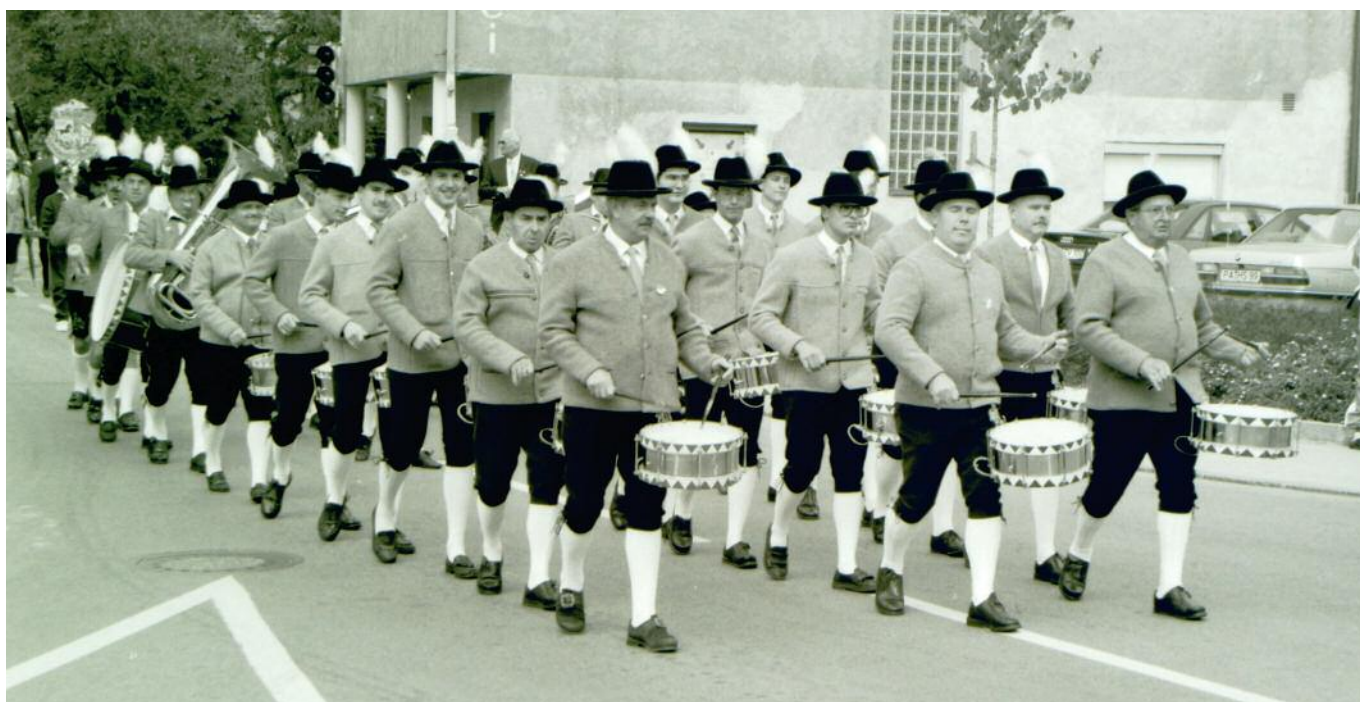
Beteiligung bei der 100-Jahrfeier des Sportvereins Pocking im Jahre 1992