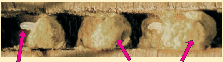
Querschnitt einer Wildbienen-Brutröhre (Schilfstängel)

Was ist hier zu sehen? Beschrifte die Abbildung (rechts)!