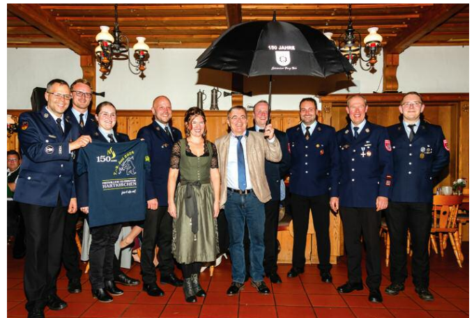
Schirmherren- und Festmutterbitten November 2022.