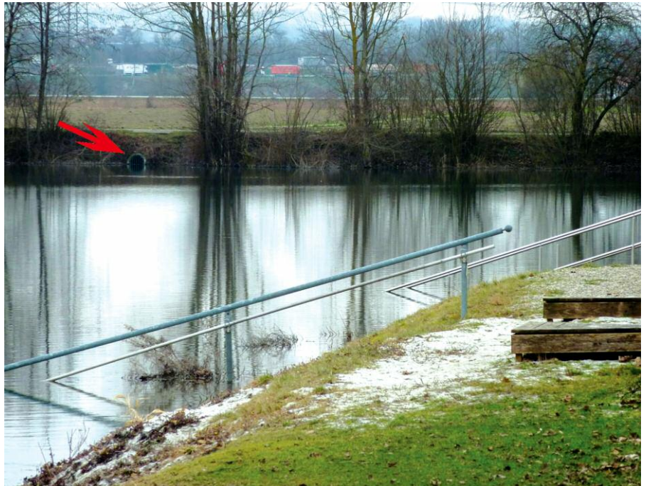
Die Rohrverbindung (siehe Pfeil), die einen Abfluss des Grundwassers vom Hartkirchener Badesee in Richtung Zeller Graben und weiter zum Inn ermöglicht, ist erstmals seit 2002 „im Einsatz“.

Auch die neuen Brücken, die das Naturfreibad in südlicher Richtung begrenzen, können nun nicht mehr genutzt werden: die fest montierten Zugänge am Ufer sind unter Wasser. Ebenso kann man am Badesee Hartkirchen den hohen Grundwasserstand beobachten. Dort wurde in Folge des bundesweiten Sommerhochwassers 2002 – als sogar die Bundeswehr zur Sicherung von Deichen in Ostdeutschland eingesetzt wurde – in östlicher Richtung eine Verbindung