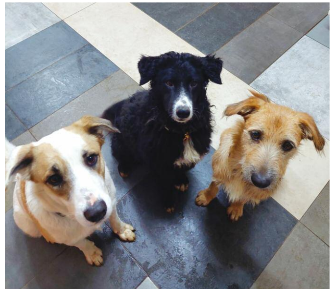
Mira, Clarcky und Bonzo suchen noch ihr Traum-Zuhause.