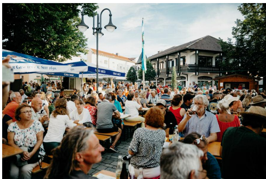
Wie bereits im Vorjahr kann sich das Publikum auch 2024 auf ein buntes und abwechslungsreiches Musikprogramm freuen.

Alle weiteren Informationen inkl. Videos und Kurzportrait der Teilnehmer/-innen sind mit folgendem QR-Code abrufbar: