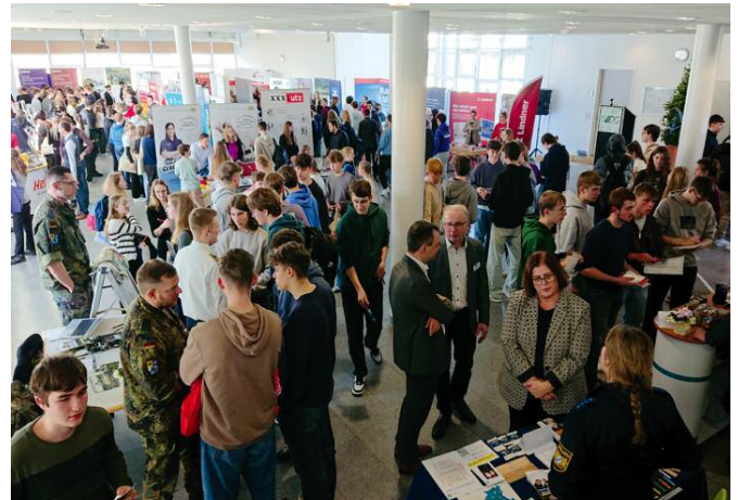
400 Schülerinnen und Schüler und über 60 Aussteller tummeln sich in der Aula des Wilhelm-Diess-Gymnasiums, knüpfen Kontakte und sprechen über Berufs- und Studienmöglichkeiten.