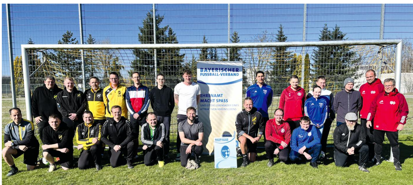
Die Teilnehmer an der BFV-Schulung „Fit für Kids“ hatten großen Spaß auf der Anlage des FC 1960 Indling e.V. und freuen sich bereits, das Erlernte in den eigenen Vereinen umzusetzen.