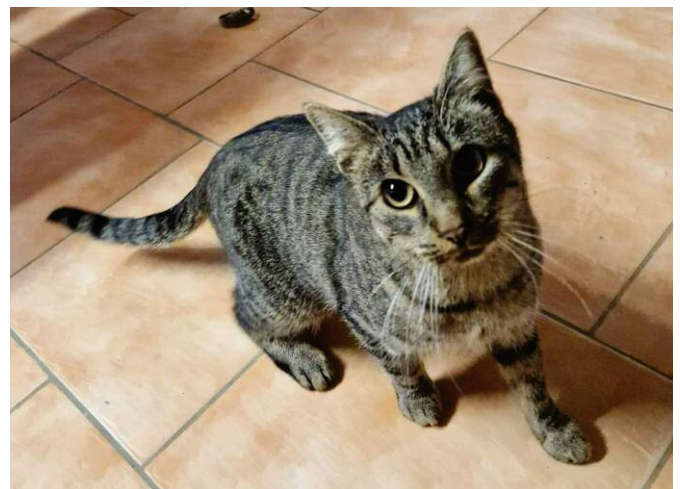
Sammy die schüchterne Tigerdame sucht auch noch ihr Zuhause.