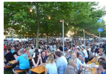
Das Pockinger Bürgerfest