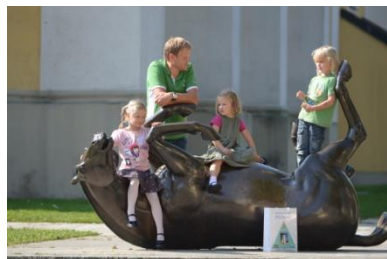
Das Pockinger Wahrzeichen: Die wälzende Stute