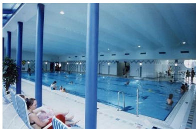
Das Pockinger Hallenbad

Aber auch für „Nicht-Sportler“ ist bestens gesorgt: Die Stadtbücherei versorgt die Bevölkerung jederzeit mit den neuesten Werken. In der angeschlossenen Heimatausstellung kann man sich ausführlich über die Geschichte Pockings informieren und archäologische Fundstücke bewundern. Kulturfreunde kommen bei den Veranstaltungen in der neu umgebauten Pockinger Stadthalle auf Ihre Kosten.